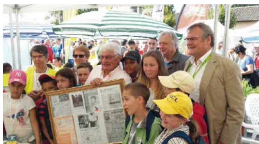
Le Bulletin de Saint-Paul N°66

Nous ne pouvons terminer cet article sans saluer la mémoire de Raymond Poulidor qui, tous les ans, accueillait les enfants du SPF sur le Tour du Limousin.