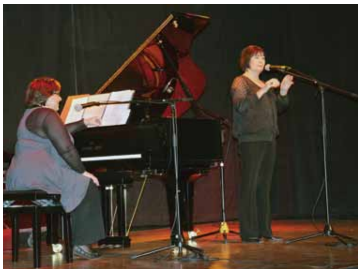
Les tatas flingueuses