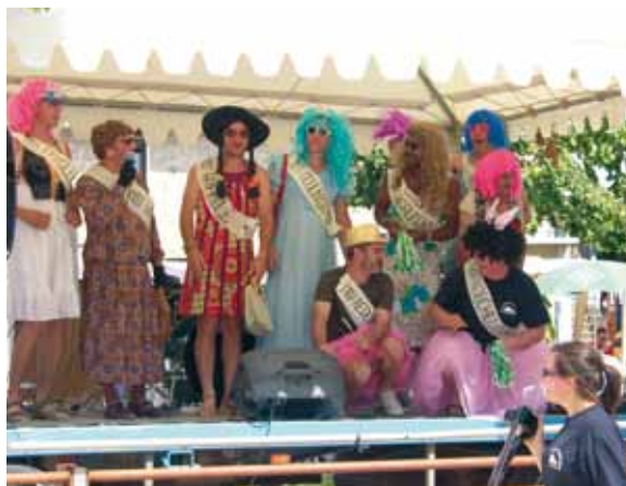
Élection de Miss St Paul