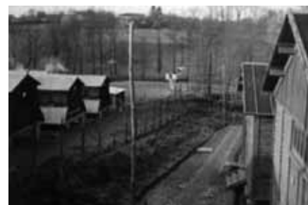
A droite, les baraquements des gardiens, à gauche ceux des "surveillés", au fond le bourg (1942)