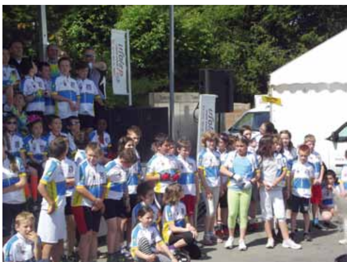
Les enfants de l'école de Saint Paul accompagnés de leurs enseignants et de parents ont parcouru 28 km sur un circuit autour de Panazol.