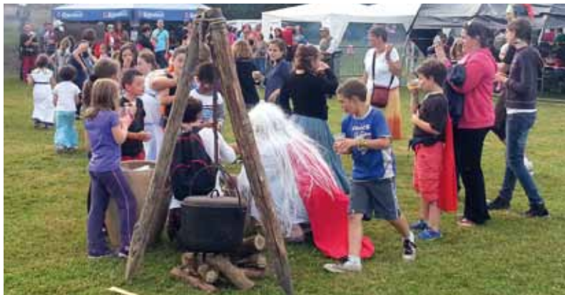
Le druide et les irréductibles !

L'association des parents d'élèves « La Marelle » a organisé sa traditionnelle et sympathique fête de l'école; le thème de cette année était « Bienvenue à Saint Paulix ».