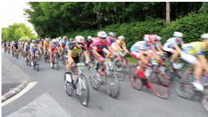
Merci à la vingtaine de signaleurs de Saint-Paul qui ont participé au bon déroulement de la course.

La Limousine André DUFRAISSE a traversé Saint-Paul le 7 juin