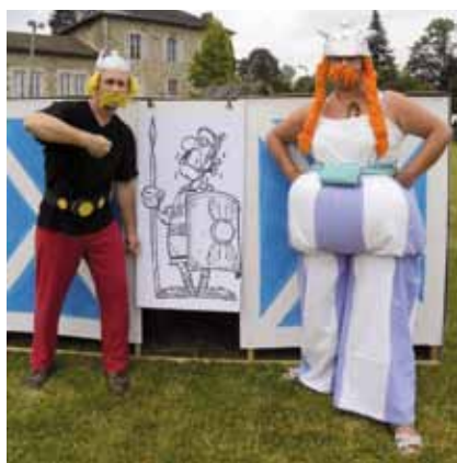
Distribution de la potion magique !