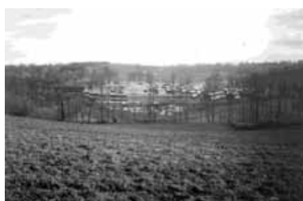
Vue générale du camp de Saint-Paul (1942)