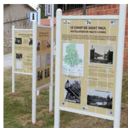
Le sentier de mémoire

Après avoir interprété le Chant de la Libération du camp, le Chant des Partisans puis la Marseillaise, les enfants de l'école de Saint-Paul sont allés déposer une rose sur la stèle à la mémoire des déportés.