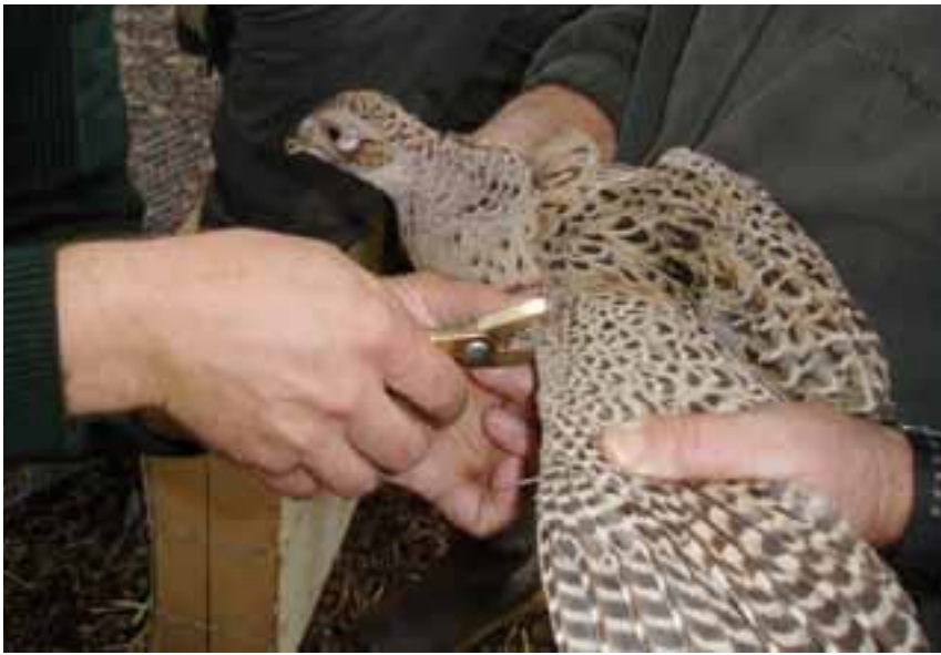
Poule faisane munie d'une bague avant son lâcher en volière.