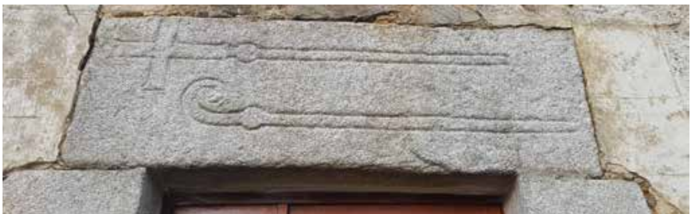
Linteau de porte à Nontyon

Linteau de porte à Nontyon. Réemploi d'une pierre tombale : La présence d'une croix et d'une crosse indique un abbé ou une abbesse. L'hypothèse la plus probable est le réemploi de la pierre tombale d'une abbesse issue de l'Abbaye de religieuses Bénédictines des Allois. Cette Abbaye a été fondée vers 1137 et dirigée par des abbesses. Les religieuses seront transférées en 1750 à Limoges. L'Abbaye est détruite à la révolution et sert ensuite de carrière de pierres.