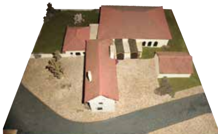
Maquette de la salle

Le chantier était plutôt considérable pour une commune comme Saint-Paul ! La grue mise en place à son ouverture était assez imposante et pouvait surprendre !