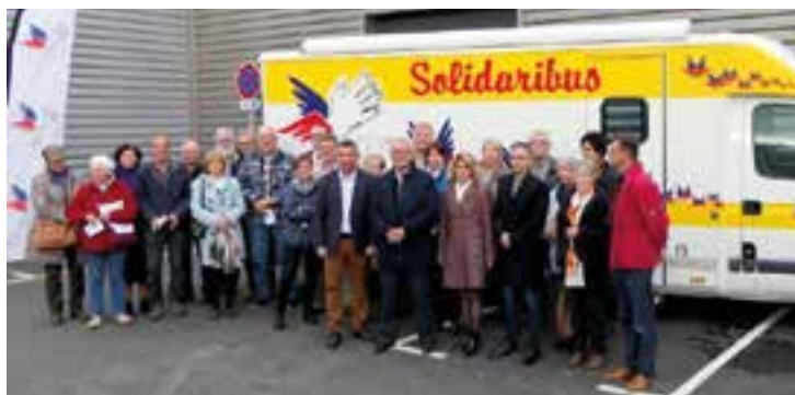
Les 10 ans du Solidaribus

CONTACT : SPF Limoges - Tél. 05 55 04 20 00