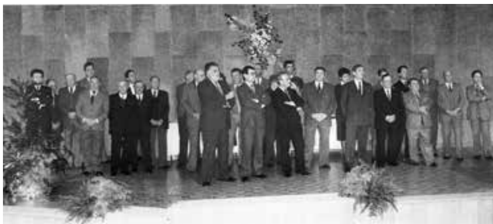
Inauguration Officielle le samedi 26 novembre 1988.