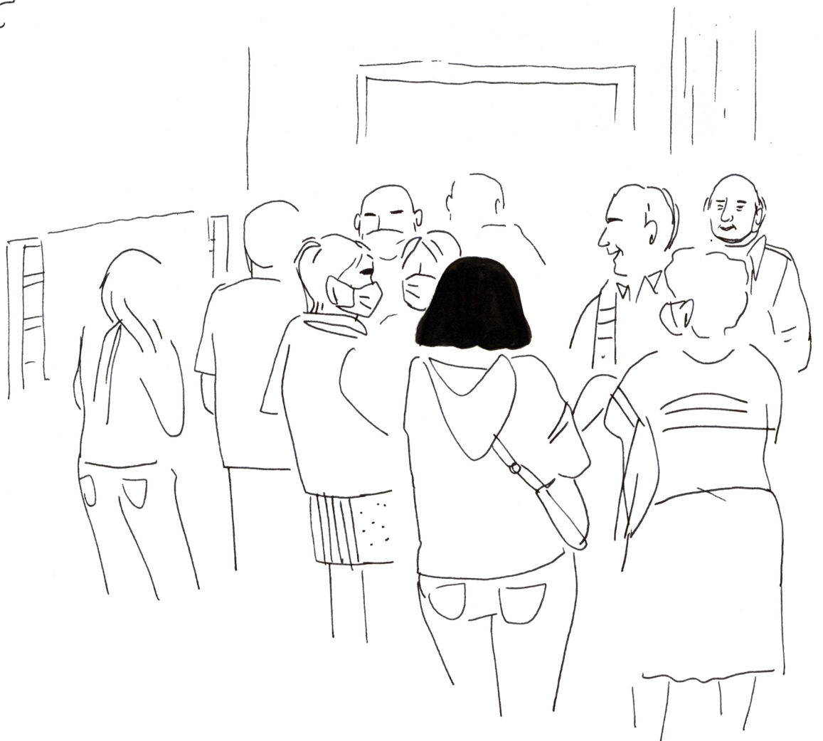
Quart d'heure limousin à la buvette du MAS avant le concert