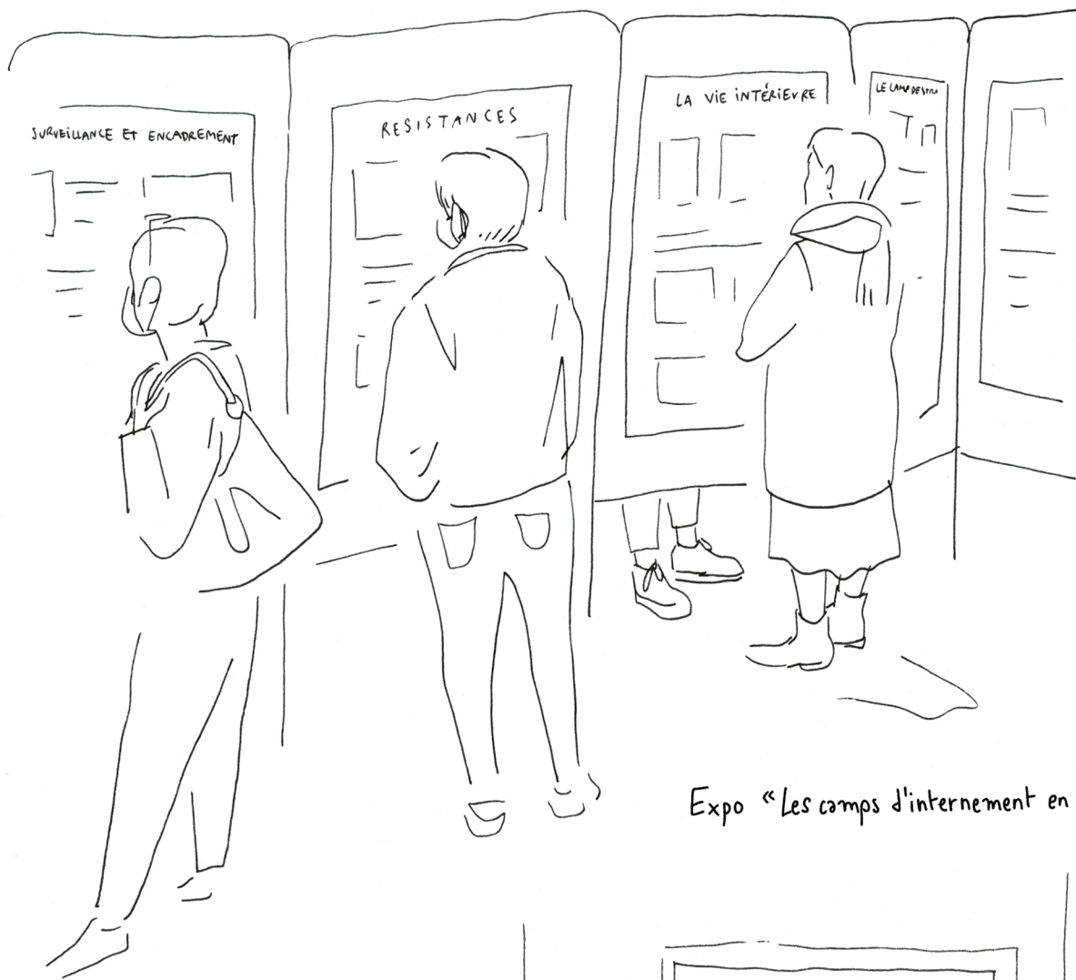
Expo «Les camps d'internement en Limousin»